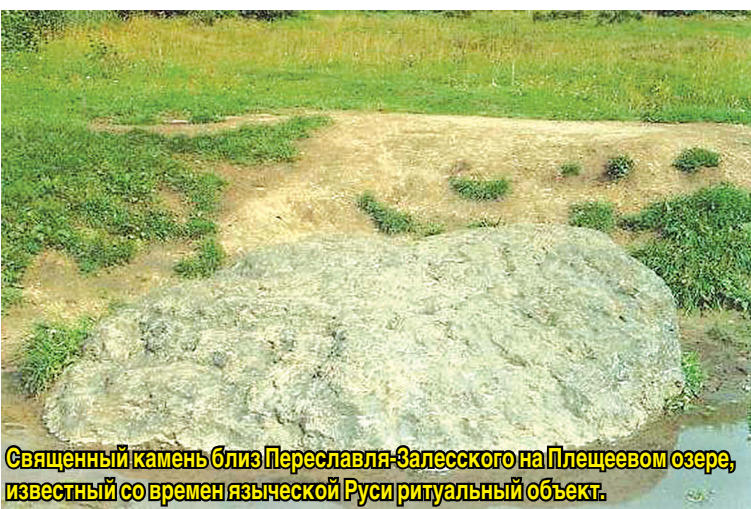
Священный камень близ Переславля-Залесского на Плещеевом озере, известный со времен языческой Руси ритуальный объект.