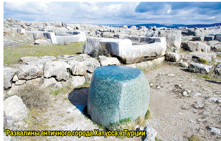
Развалины античного города Хатусса в Турции

Забвению мертвыми мира живых способствует и вода из реки Лета, которая сама находится в подземном мире и в которую, оказывается, нельзя кануть живому человеку, ведь потеря памяти есть одно из условий смерти. Урызмаг остается жить, но его беспамятство вносит дисгармонию в мир Барастыра, и напоминание мальчиком своему родителю о необходимости помнить о нем и поминать его является свиде-