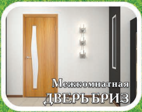
Межкомнатная ДВЕРЬ БРИЗ