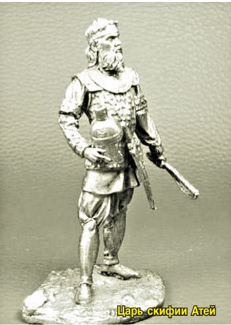
Царь скифии Атей

Значительная часть статьи посвящена анализу легенд и преданий скифов и их аналогиям в осетинской традиции: гаданию на палочках, почетной чаше и т.д. В статье обрисованы образы знаменитых женщин-воительниц (Амага, Таргитао), двух скифов – Дандамиса и Амизона, описанных Лукианом Самосатским, которые прославили свои имена навеки необыкновенно крепкой дружбой; в ней раскрывается смысл обычая садиться на шкуру заколотого быка и др. Описывая скифские фольклорные древности, автор не задавался целью обязательно находить им эквиваленты в быту алан. Этого он не делает потому, что, во-первых, исходит из аксиомы: язык и быт алан идентичны скифам и, во-вторых, «...скифские истории базируются на местных сказаниях... подобные темы могли таким же образом быть популярны среди сарматов».