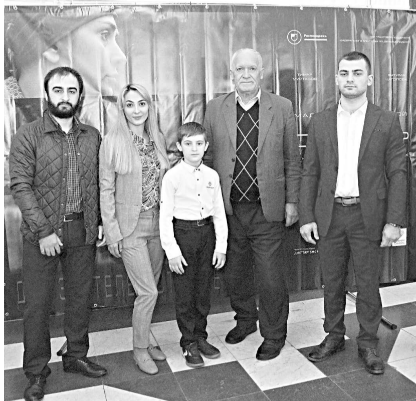
Ю. СЛАНОВА.

В день показа в Доме кино зрительный зал был переполнен. Желающих увидеть загадочную историю, произошедшую с главным героем, пришло достаточно много, и поэтому фильм был показан в два сеанса. «Честно признаться, я и предполагать не могла, что придет так много людей. Значит, фильм вызвал неподдельный интерес, и это не может не радовать», – добавила Мадина Тоголокова.