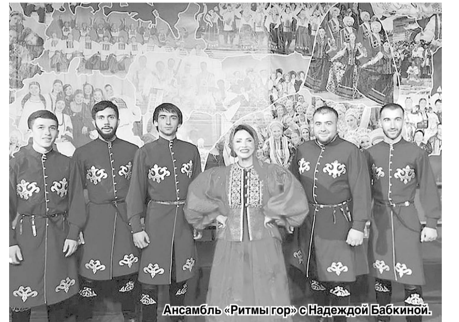
Ансамбль «Ритмы гор» с Надеждой Бабкиной.

На Ставрополье завершился 15-й по счету юбилейный фестиваль-марафон «Русская песня»-2021. Мероприятие является совместным проектом Благотворительного фонда «Народная певческая культура» и Всероссийской политической партии «Единая Россия» при организационной и финансовой поддержке Министерства культуры Российской Федерации.