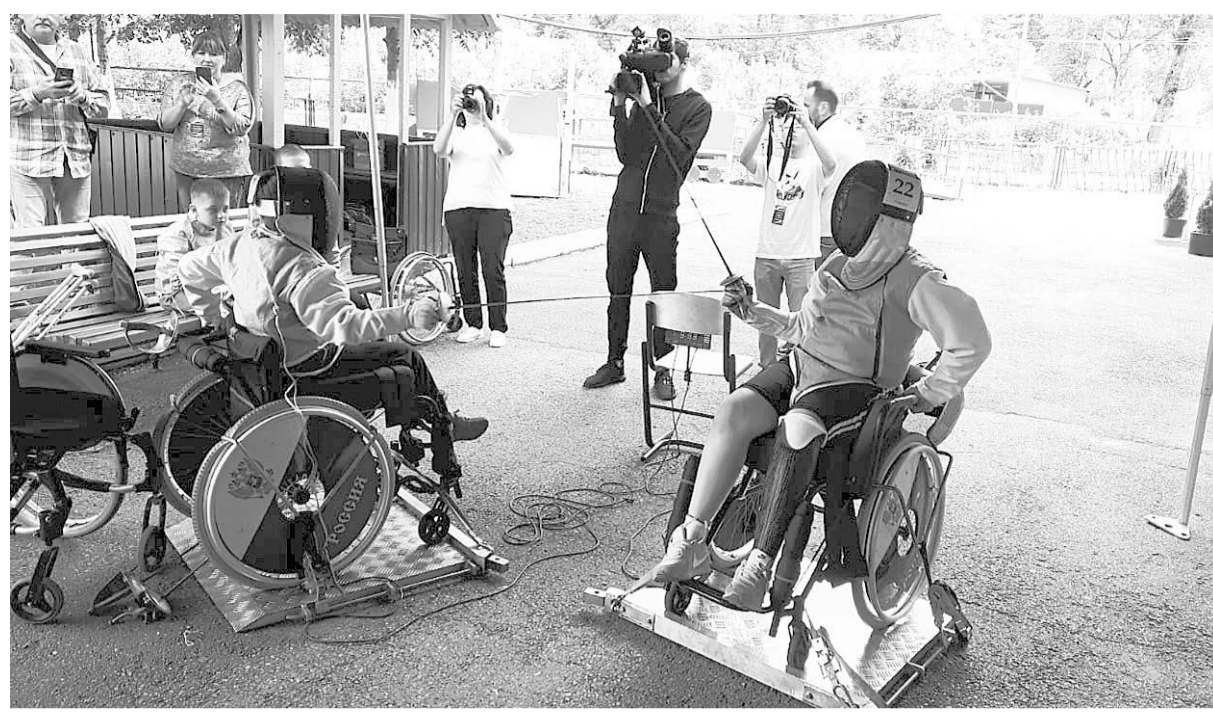
дим новые достижения участников и надеемся, что на наших площадках появится еще много добровольческих инициатив...