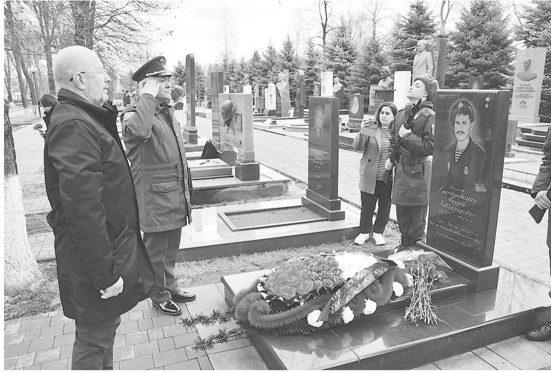
Всех, кто помогает мне в сохранении памяти погибших ребят.