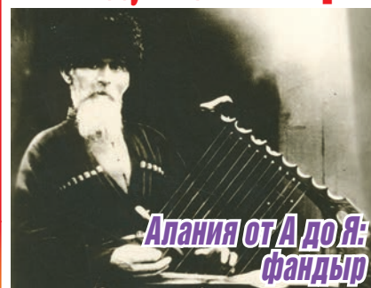
Алания от А до Я: фандыр