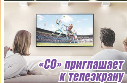
«СО» приглашает к телеэкрану