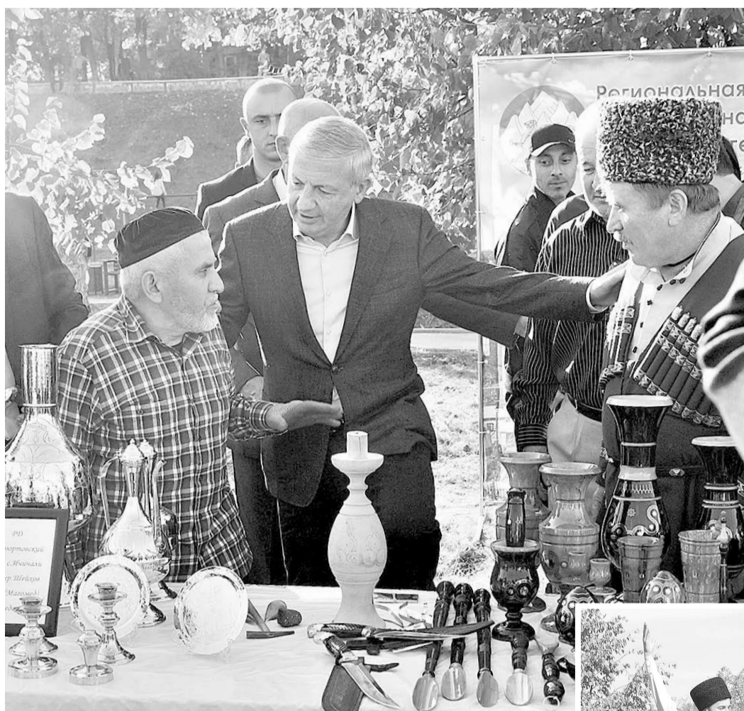
В воскресенье на набережной по ул. К. Кесаева жители республики отпраздновали 236-летие города Владикавказа.

Согласно санитарно-эпидемиологическим рекомендациям, мероприятия, посвященные празднованию Дня города, в этом году пришлось провести в одной локации.