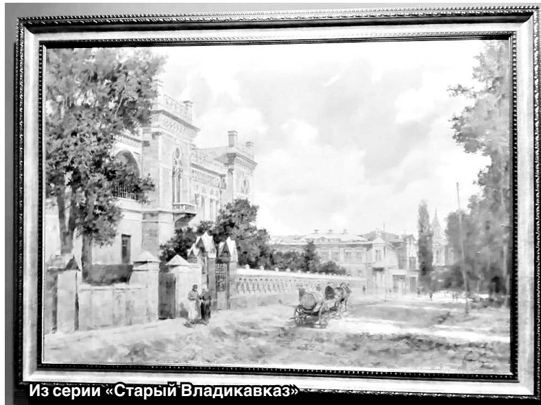
Из серии «Старый Владикавказ»