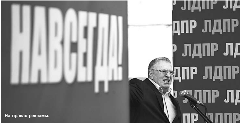
На правах рекламы.

Основной проблемой оказалось противоречие между стремлением повторять путь России и не повторять его. Путь России Украине повторить не удалось: и все достоинства, и все проблемы выглядят карикатурно. Но и для каких-то иных способов существования Украина не располагает ни интеллектуальными, ни культурными, ни политическими, ни экономическими ресурсами».