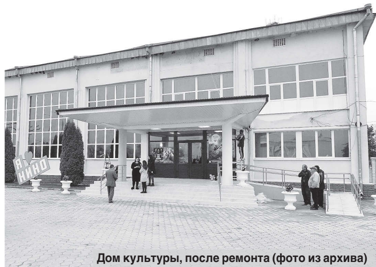
Дом культуры, после ремонта

и реализации госпрограмм, готовятся и подаются бюджетные заявки на участие в них, а также мы сопровождаем прохождение заявок в республиканских и федеральных органах власти.