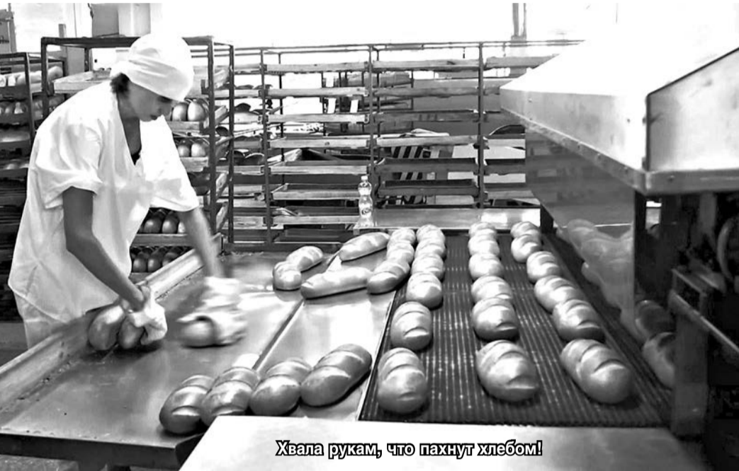
Хлеба руками, что пахнут хлебом!

А что думают о качестве хлеба в Управление Роспотребнадзора по РСО-А?