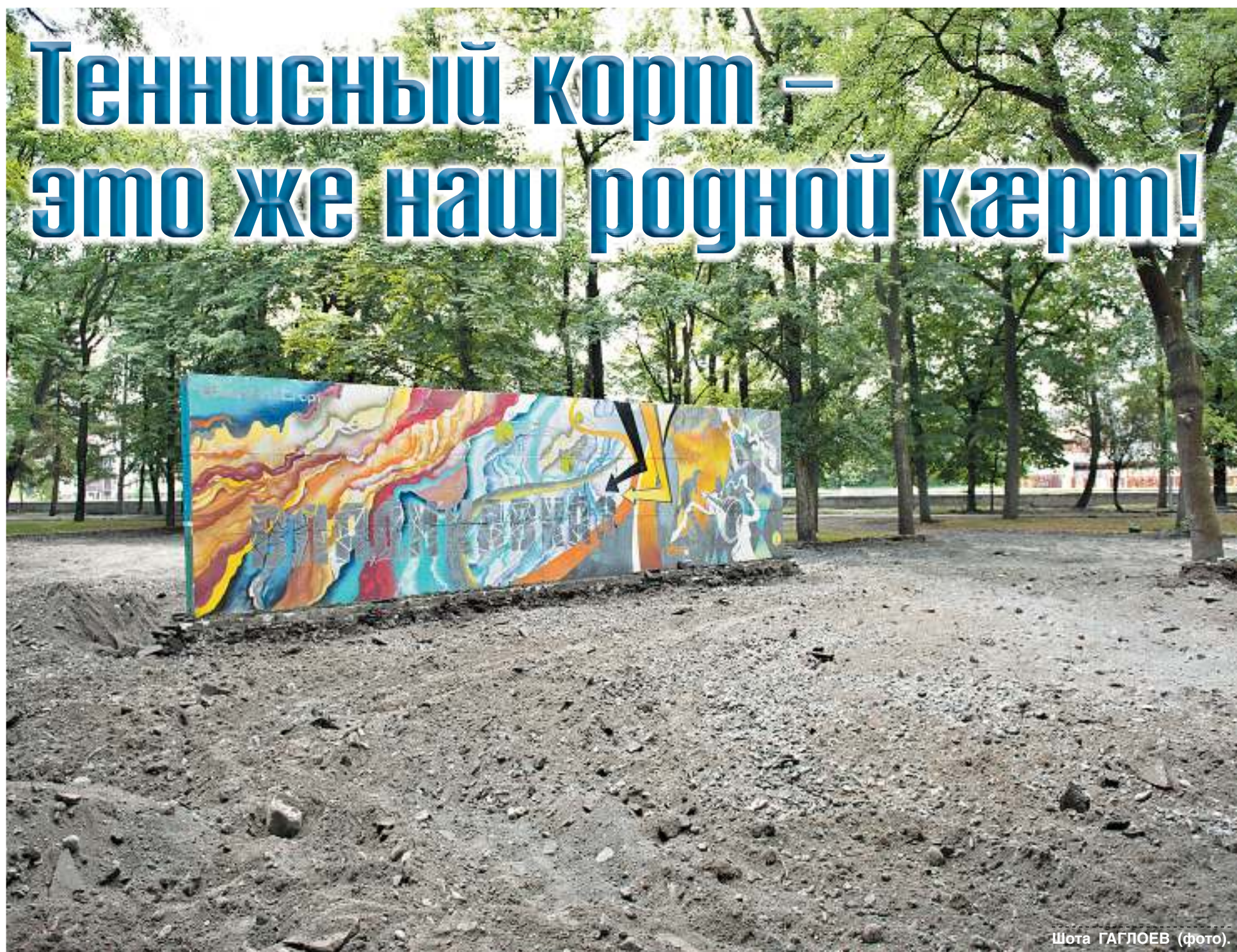
Шота ГАГЛОЕВ (фото).