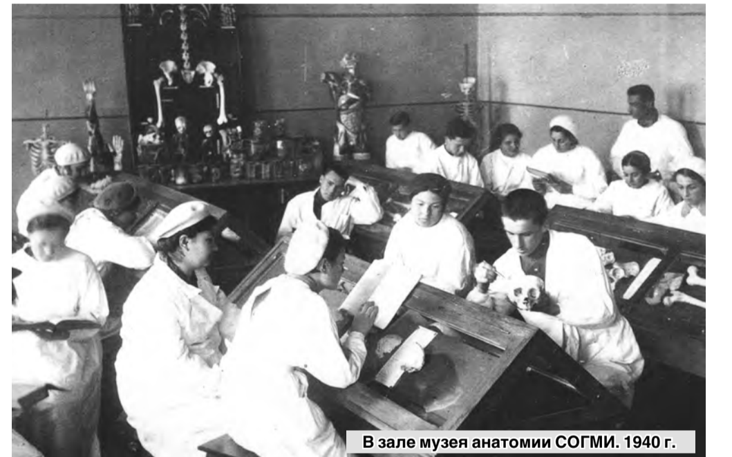
В зале музея анатомии СОГМИ. 1940 г.