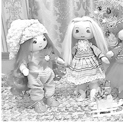
создавать красоту из подручных материалов – ниток, кожи, кусочков ткани... «Как говорится, хорошей хозяйке всегда пригодится, чего только в моей мастер-

ской нет, даже втулки от тканевых и бумажных полотенец, они могут понадобиться при изготовлении», – говорит умелица.