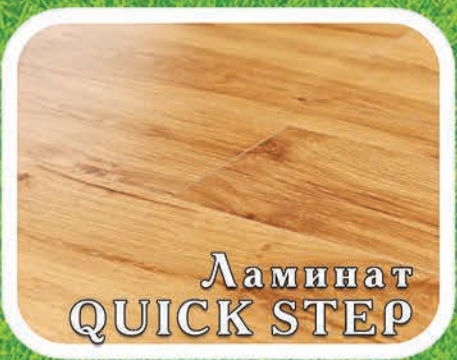
Ламинат QUICK STEP