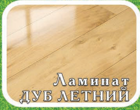
Ламинат ДУБ ЛЕТНИЙ