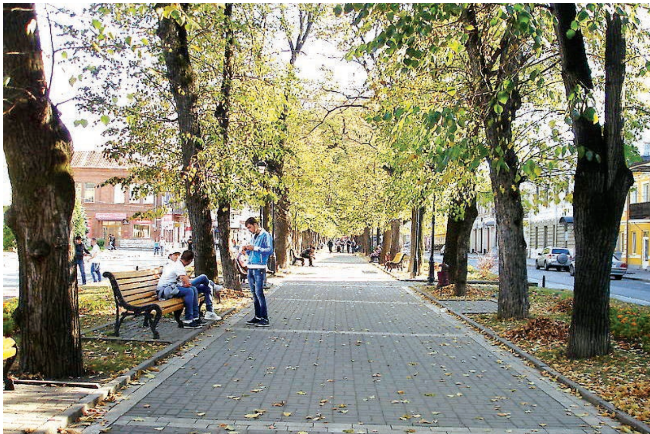
Нестеровского, по имени ген. Нестерова, который насадил его в 1844 г. При окончании его прекрасный чугунный мост, именуемый Ольгинским в честь Великой княгини Ольги Федоровны и выстроенный в 1863 году».

В 59-м томе литературного и политического журнала «Русский вестник» за 1865 г. были опубликованы путевые