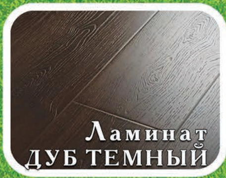
Ламинат ДУБ ТЕМНЫЙ