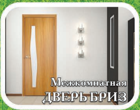
Межкомнатная ДВЕРЬ БРИЗ