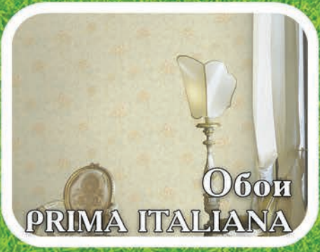
Обои PRIMA ITALIANA