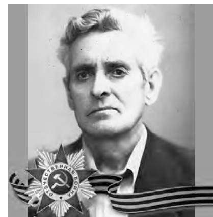
ГУРЦИЕВ Хазби Николаевич (1922–2012)