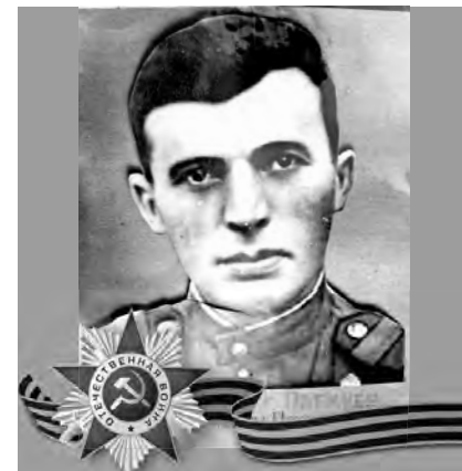
ЛАГКУЕВ Мухарбек Болаевич (1916–1955)