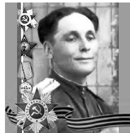
ГУРЦИЕВ Давид Николаевич (1912–1984)