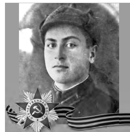
МАЛИЕВ Георгий Декович (1924–1942)