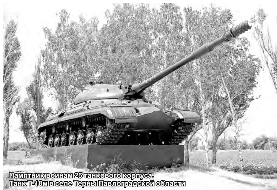
Памятник воинам 25 танкового корпуса. Танк Т-10м в селе Терны Павлоградской области