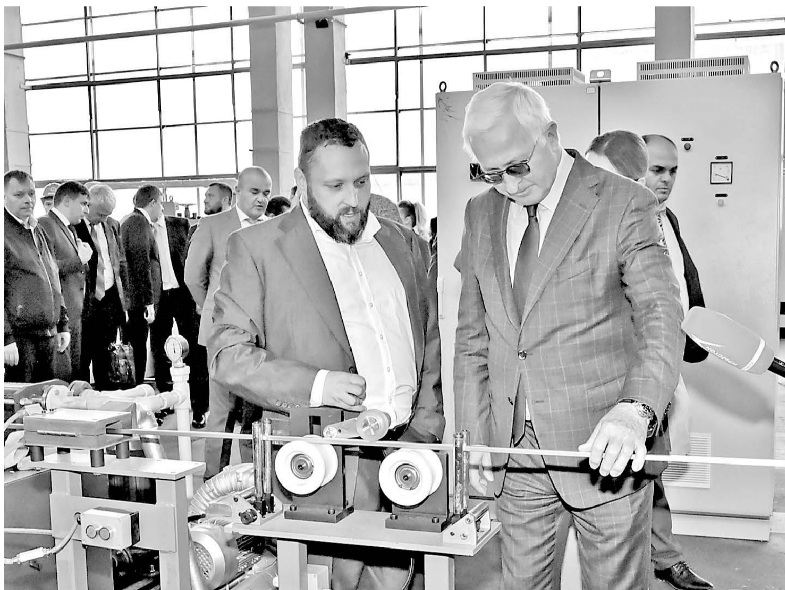
В рамках работы координационного совета в Северной Осетии Александр Шохин (справа) побывал на заводе «Кристалл». Его ознакомили с процессом выпуска вакуумной бескислородной меди и различных сплавов на основе меди, используемых при производстве электронной, радиоэлектронной аппаратуры и точных приборов.

Что нужно, для того чтобы бизнес успешно развивался? Не только начальный капитал и концепция развития. Нужны грамотные кадры, подготовленные не вообще, а для узкого сегмента отрасли, и еще лучше – для конкретного предприятия, а еще – своевременные и доступные меры поддержки со стороны государства и инвесторов, нужны стабильность и предсказуемые правила игры. Об этом и многом другом говорили на заседании координационного совета отделений Российского союза промышленников и предпринимателей (РСПП) в СКФО. В его работе приняли участие Глава РСО-А Сергей МЕНЯЙЛО, президент РСПП Александр ШОХИН, заместитель полномочного представителя Президента РФ в СКФО Владимир НАДЫКТО.