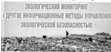
Том первый – Теоретические вопросы