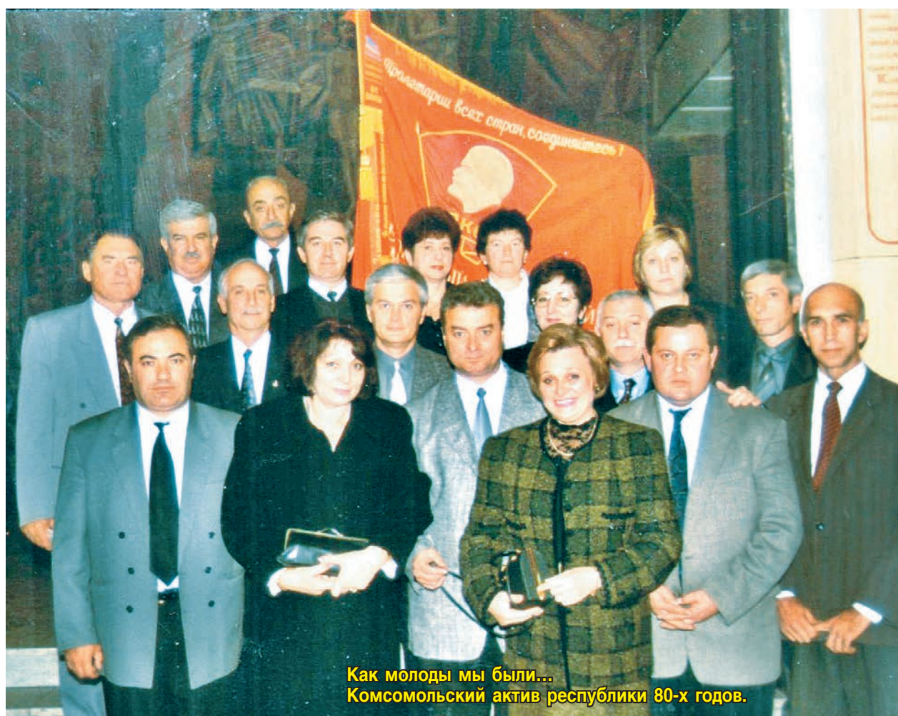
Как молоды мы были... Комсомольский актив республики 80-х годов.