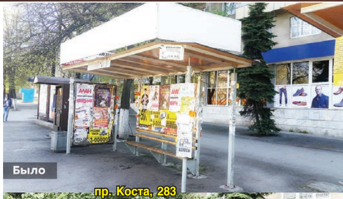
Было пр. Коста, 283