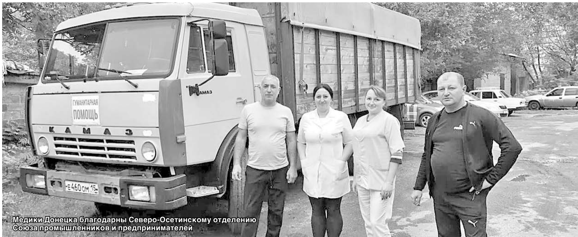
Медики Донецка благодарны Северо-Осетинскому отделению Союза промышленников и предпринимателей