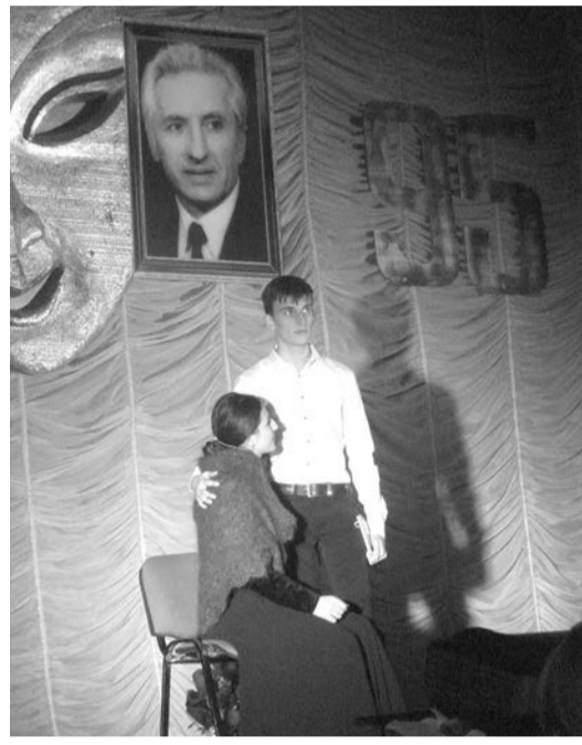
Отрывки из спектаклей и кинофильмов, театрализованная постановка о юности Николая Саламова, воспоминания коллег по театру о том, каким он был артистом и человеком... Тематический концерт-спектакль прошел на одном дыхании, на сцену выходили люди, которых связывали с Николаем Саламовым и первые шаги в профессии, и многие годы совместной работы. И эти воспоминания рисовали перед зрителями образ солдата Великой Отечественной, прошедшего огненными фронтами дорогими и получившего тяжелые ранения, актера, сыгравшего более 200 ролей в театре и кино, педагога и наставника.

Вечер, посвященный 95-летию народного артиста СССР Николая Саламова, состоялся в Ардоне. В районном Дворце культуры собрались артисты Северо-Осетинского государственного драматического театра им. В. В. Тхапсаева, вместе с которыми десятки лет служил искусству Николай Михайлович, деятели кино, студенты республиканского колледжа культуры, представители фамилии и многочисленные почитатели таланта прославленного земляка.