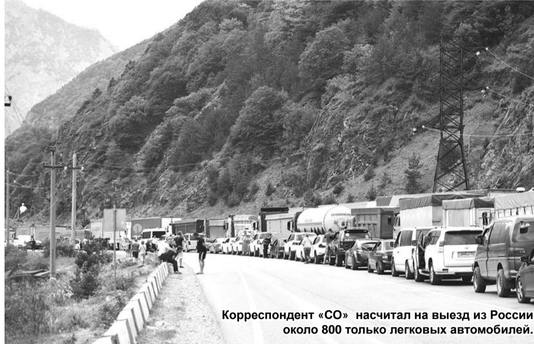
Корреспондент «СО» насчитал на выезд из России около 800 только легковых автомобилей.

Специфично несение службы и по складывающейся обстановке. Причиной тому — значительный объем контрабандных товаров, попытки ввоза которых предпринимаются регулярно.