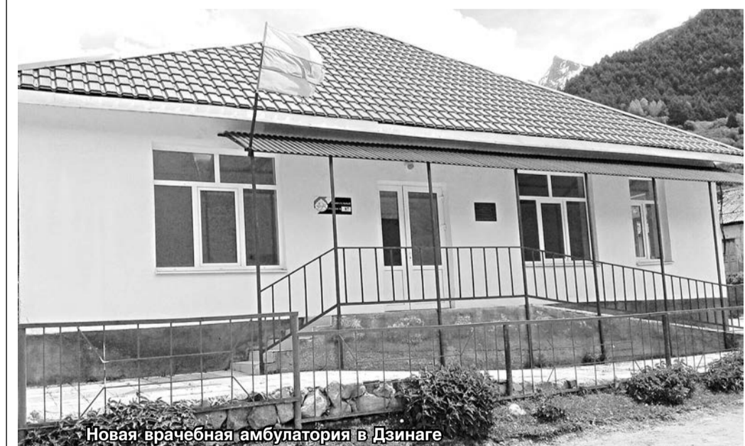
Новая врачебная амбулатория в Дзيناге

Во время своей ежегодной пресс-конференции, которая прошла в конце прошлого года, Президент России В. Путин акцент сделал на то, что в малых населенных пунктах, где проживают от 100 до 2 тысяч жителей, нужно создавать современные фельдшерско-акушерские пункты, а те, которые были ранее закрыты, возродить. Для обслуживания меньших поселений он дал поручение использовать передвижные станции оказания медицинской помощи.