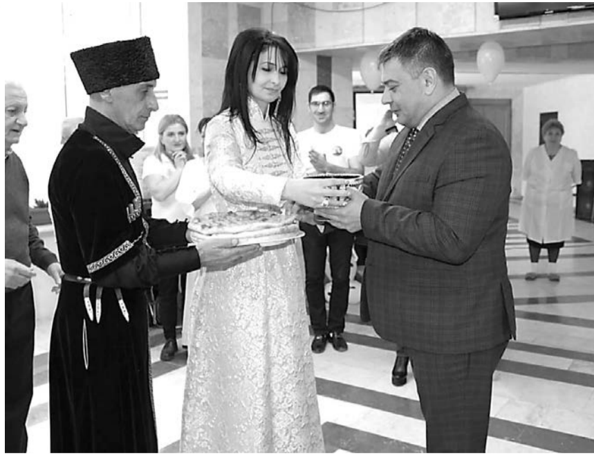
Кроме позитивных эмоций сотрудники получили новые знания о том, как работать в команде. Без этого вряд ли можно добиться высоких результатов. Сплоченный коллектив, чувство доверия и взаимопонимания между коллегами – это составляющие успеха. Все победители были награждены грамотами Министерства труда и социального развития РСО-А.

По итогам творческого театрального конкурса лучшей признана команда УСЗН Дигорского района «Доброе сердце», второе место у «Золотой молодежи» Алагирского района, на третьем – команда Ирафского района «Лучики надежды».