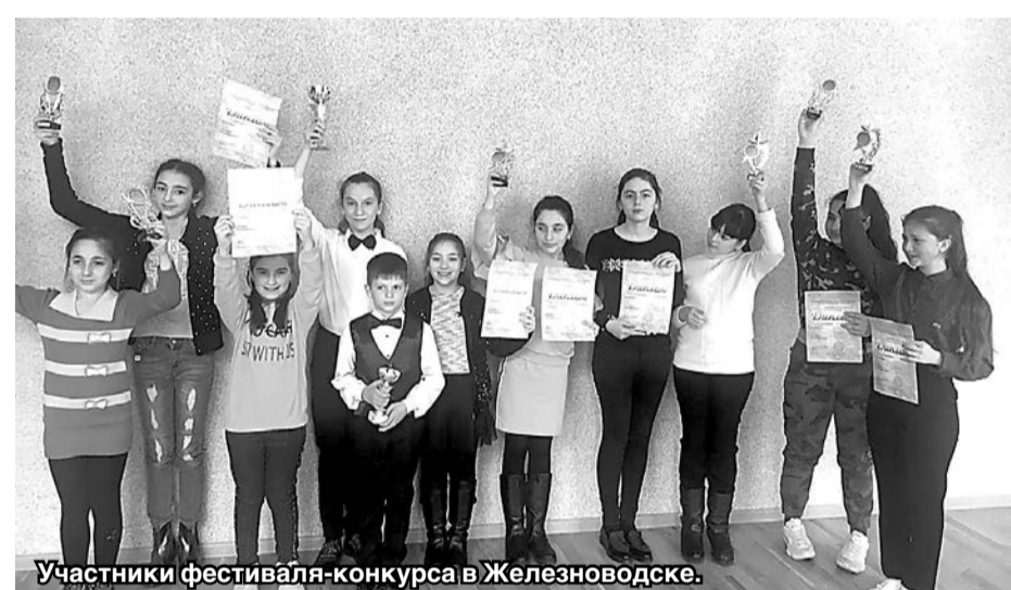
Участники фестиваля-конкурса в Железноводске.

В городском Дворце культуры курортного города Железноводска завершился I X международный фестиваль-конкурс детского и юношеского творчества «Звездный дождь».