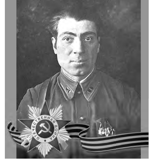
ГАБОЛАЕВ Георгий Анзоревич (1909–1982)