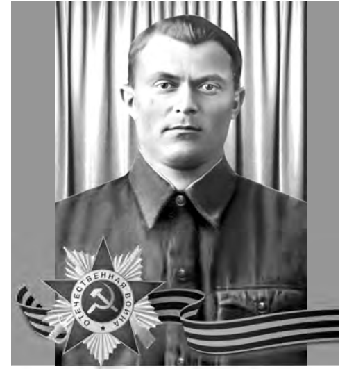
БУГУЛОВ Кудайнат Татариевич (1917–1967)