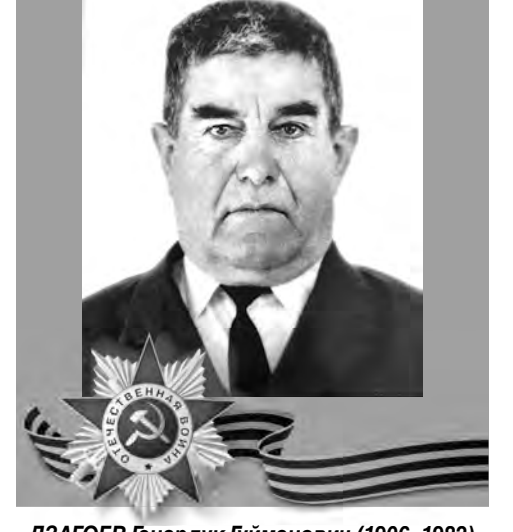
ДЗАГОЕВ Генардук Гуйманович (1906–1982)