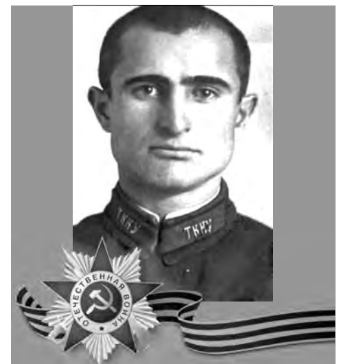
БЕСОЛОВ Садон Хадзиметович (1914–1941)