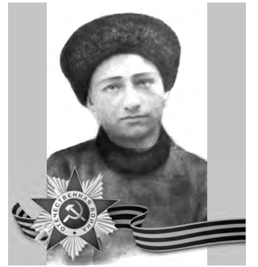
БАЙМАТОВ Тотык Темырович (1906–1965)