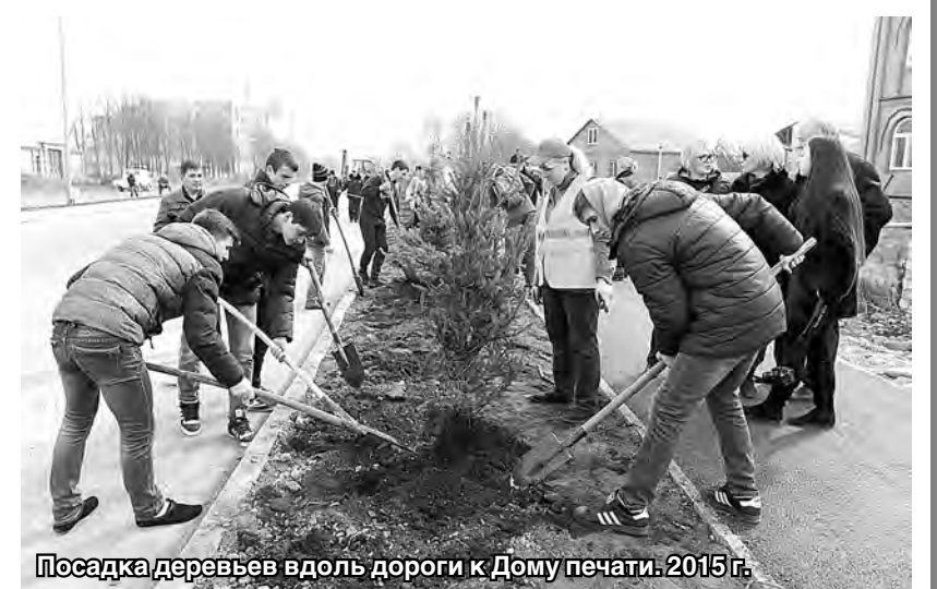
Посадка деревьев вдоль дороги к Дому печати. 2015 г.

Чтобы разбудить естественный долг каждого разумного человека, его желание посадить свое дерево, необходимо обратить внимание на большое разнообразие чудесных, вкусных, красивых и полезных для здоровья человека плодов.