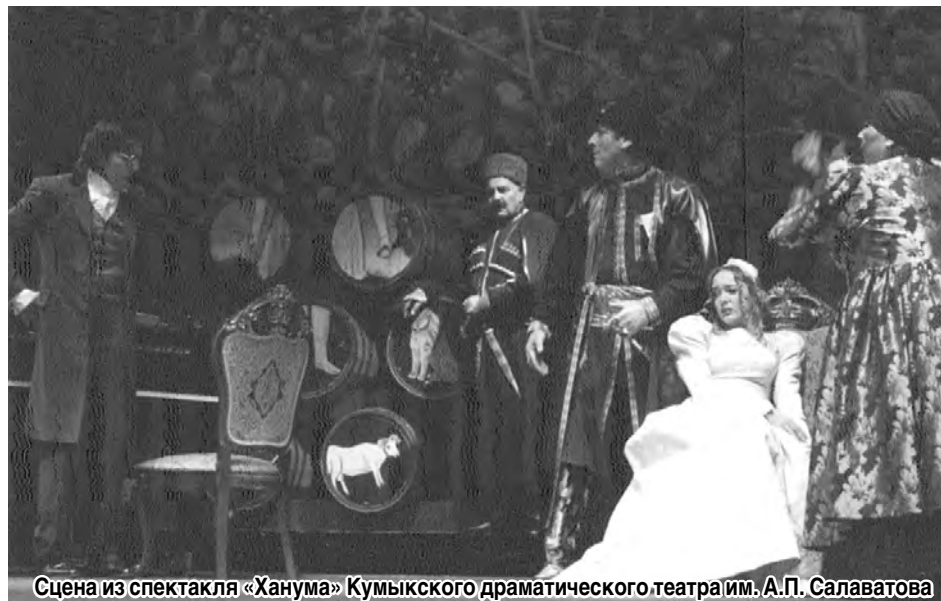
Сцена из спектакля «Ханума» Кумыкского драматического театра им. А.П. Салаватова

Взявший «старт» во Владикавказе 4 ноября IX международный фестиваль национальных театров «Сцена без границ», который проходит в республике под эгидой Союза театральных деятелей РСО-А и при поддержке Министерства культуры РФ, Минкультуры РСО-А и СТД России, продолжает набирать обороты. Продолжит он в столице Северной Осетии, как уже сообщила «СО», до 8 ноября.