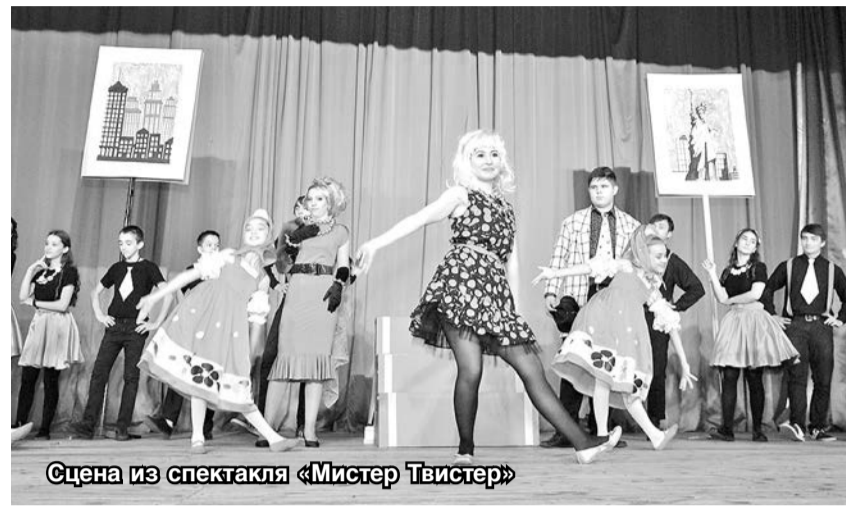
Сцена из спектакля «Мистер Твистер»

Серию ярких фестивальных мероприятий продолжит праздничная выставка работ учащихся отделения изобразительного искусства «Зимняя сказка».