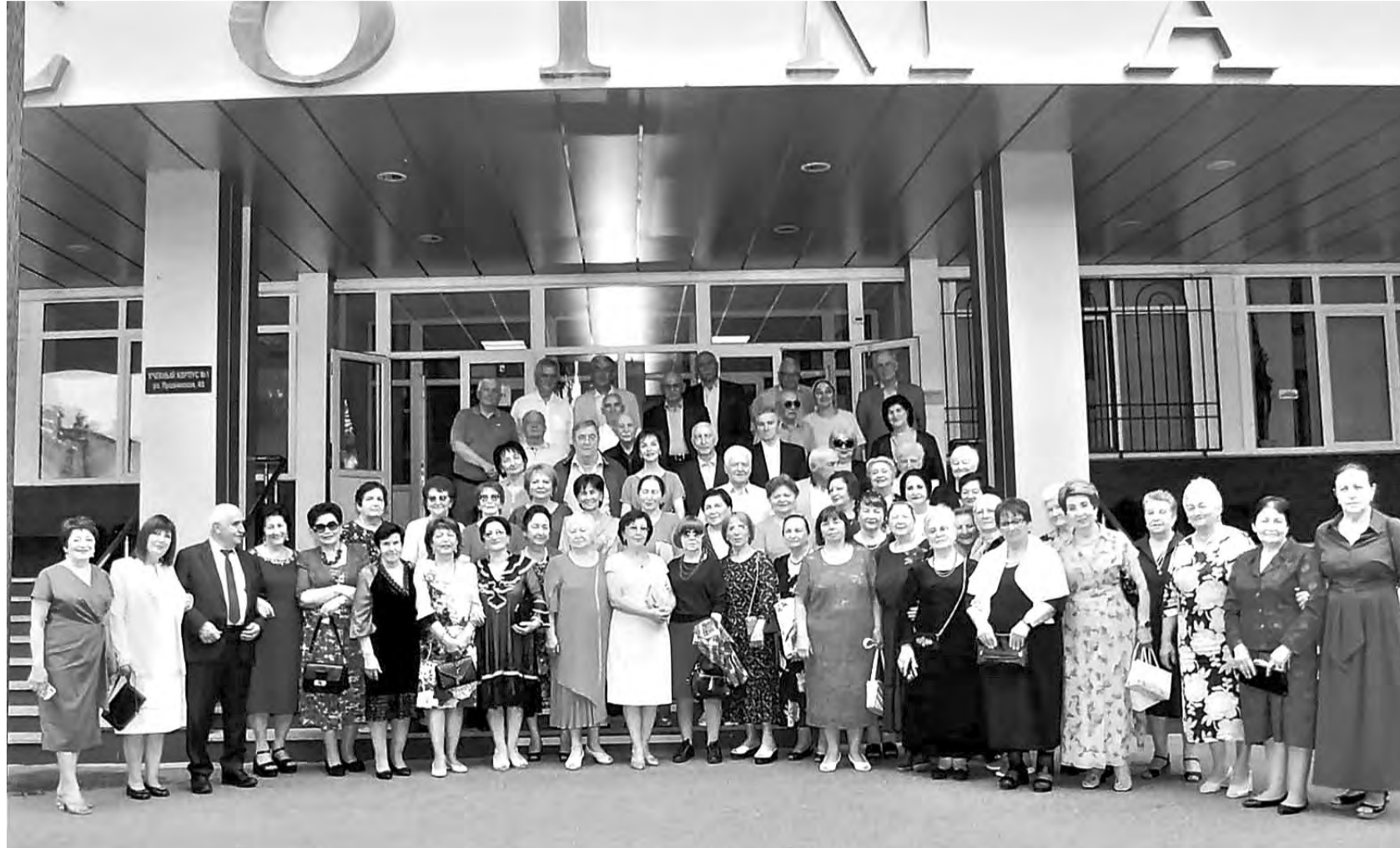
23 июля состоялась юбилейная встреча 29-го выпуска врачей Северо-Осетинского государственного медицинского института. Около 80 выпускников 1972 года собрались в этот день во дворе родного вуза – ныне СОГМА, чтобы окунуться в счастливое прошлое, вспомнить юность и вновь почувствовать дух родного мединститута...

50 лет они стояли на страже здоровья людей, выполняли свою благородную миссию в родной Осетии, городах России, а кто-то продолжал трудиться и сегодня. История жизни каждого из этих врачей, без преувеличения – биография страны со всеми ее проблемами и радостями. Успешная карьера и самостоятельность не погасили юношеский задор у выпускников. Горящие глаза, неподдельные эмоции отражали искреннюю радость от встречи с alma mater и друзьями студенчества: «Ты совсем не изменился!...» «Да, мы лишь немного повзрослели...»