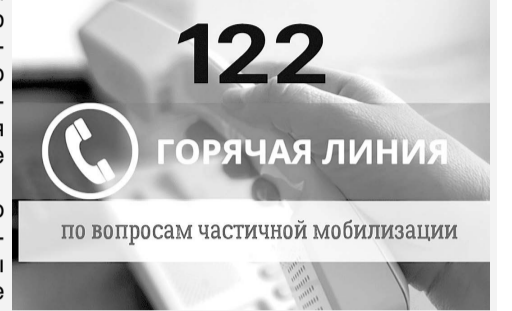
по вопросам частичной мобилизации

Напомним, 21 сентября Президент России Владимир Путин объявил о частичной мобилизации в стране. Указ был подписан в тот же день. По словам главы государства, в рамках частичной мобилизации призыву подлежат лишь граждане запаса – в первую очередь те, у кого есть опыт.