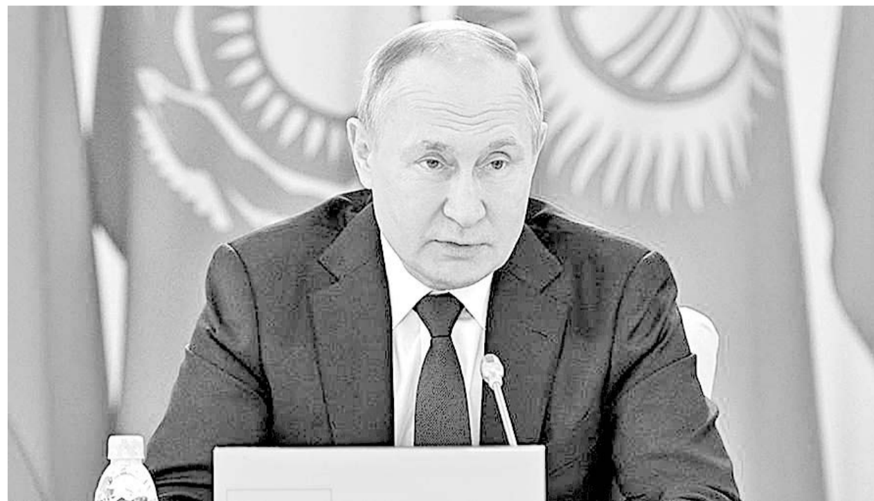
Президент РФ завершил свой двухдневный визит в Казахстан пресс-конференцией, которая смогла дать ответы на многие волнующие сегодня россиян вопросы.