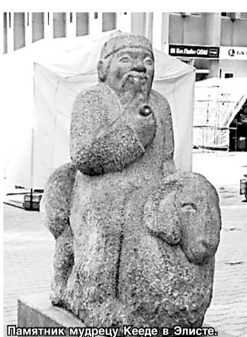
Памятник мудрецу Кеде в Элисте.

Национальный драматический театр им. Б. Басангова и ТЮЗ «СабИ» дружба связывает, к слову, давняя и очень прочная. Познакомились их коллективы в 2011 году в Грозном – на