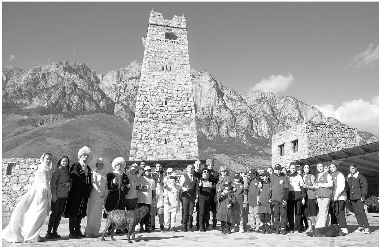
Живописное селение Унал встретило участников фестиваля «Уацамонга» с кавказским гостеприимством.