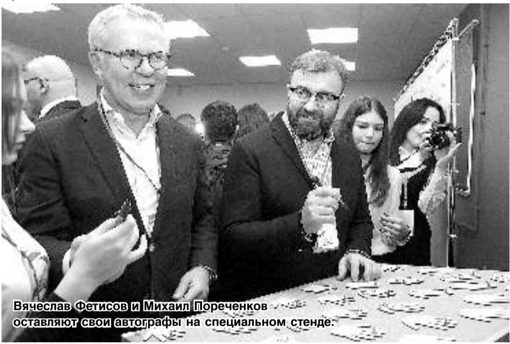
Вячеслав Фетисов и Михаил Пореченков оставляют свои автографы на специальном стенде.

становятся. Становятся те, кто способен равнодушно пройти мимо чужой беды. Сегодня добровольчество развивается по многим направлениям, наша республика активно реализует волонтерские программы, ни одно масштабное мероприятие не проходит без помощи добровольцев, которые принимают активное участие в мероприятиях даже международного уровня. И любое событие вы, ребята, превращаете в праздник. Спасибо вам!» – поприветствовал собравшихся на слет волонтеров Вячеслав Битаров, тем самым официально открыв работу форума и призвав добровольцев к активному общению, налаживанию дружеских контактов и реализации межрегиональных проектов. В торжественной церемонии, которая проходила на площади перед Дворцом культуры СОГУ, приняли участие и все почет-