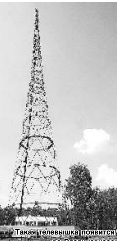
Такая телевизшка появится во Владикавказе