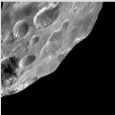
Это первая в истории детальная фотография спутника Сатурна Фебы.

Это первая в истории детальная фотография спутника Сатурна Фебы. Он, как и другие уникальные снимки, был получен благодаря автоматическому космическому аппарату «Кассини-Гюйгенс». За 20 лет работы «Кассини» бесценно обогатил знания человека о космосе, став первым искусственным спутником Сатурна. Созданный NASA, Европейским и Итальянским космическими агентствами, он был запущен 15 октября 1997 года. Зимой 2000 года зонд пролетел мимо Юпитера, передав на Землю его фотографии, а к 2004 году он достиг Сатурна. Первоначально миссия была запланирована до 2008 года, однако впоследствии ее продлили до 2010, а затем и до 2017 года. В прошлом году его ресурс был окончательно исчерпан, и последней задачей станции стало управляемое падение на Сатурн, получившее название Grand Finale.