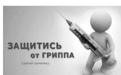
Прививку делают не позже чем за месяц до предполагаемого начала эпидемии.

Грипп может давать опасные осложнения: бронхит, пневмонию, менингит, энцефалит, которые развиваются при