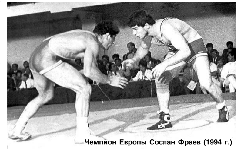
Чемпион Европы Сослан Фраев (1994 г.)

Сослан ФРАЕВ - в прошлом один из сильнейших борцов вольного стиля Советского Союза и Российской Федерации. Он оставил яркий след в истории этого вида спорта. В семнадцать лет юный парнишка из Беслана стал чемпионом молодёжного первенства Советского Союза, а в двадцатилетнем возрасте победил своих соперников в весовой категории 90 кг на Спартакиаде народов Российской Федерации.