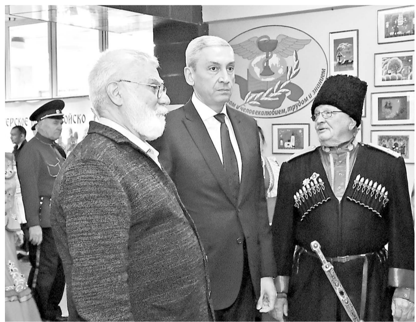
корни. Надеемся, что и дальше будем с вами вместе двигаться по жизни. Как в

«Мы впервые проводим такое мероприятие и благодарим организаторов. Спасибо, что вы нашли возможность нас посетить. Порадовала и фотовыставка, и издательская деятельность. Она чрезвычайно интересна, потому что очень многое в себе хранит и имеет глубокие корни. Надеемся, что и дальше будем с вами вместе двигаться по жизни. Как в песне пелось, радостно и смело – вперед!» – сказал ректор СОГМА.