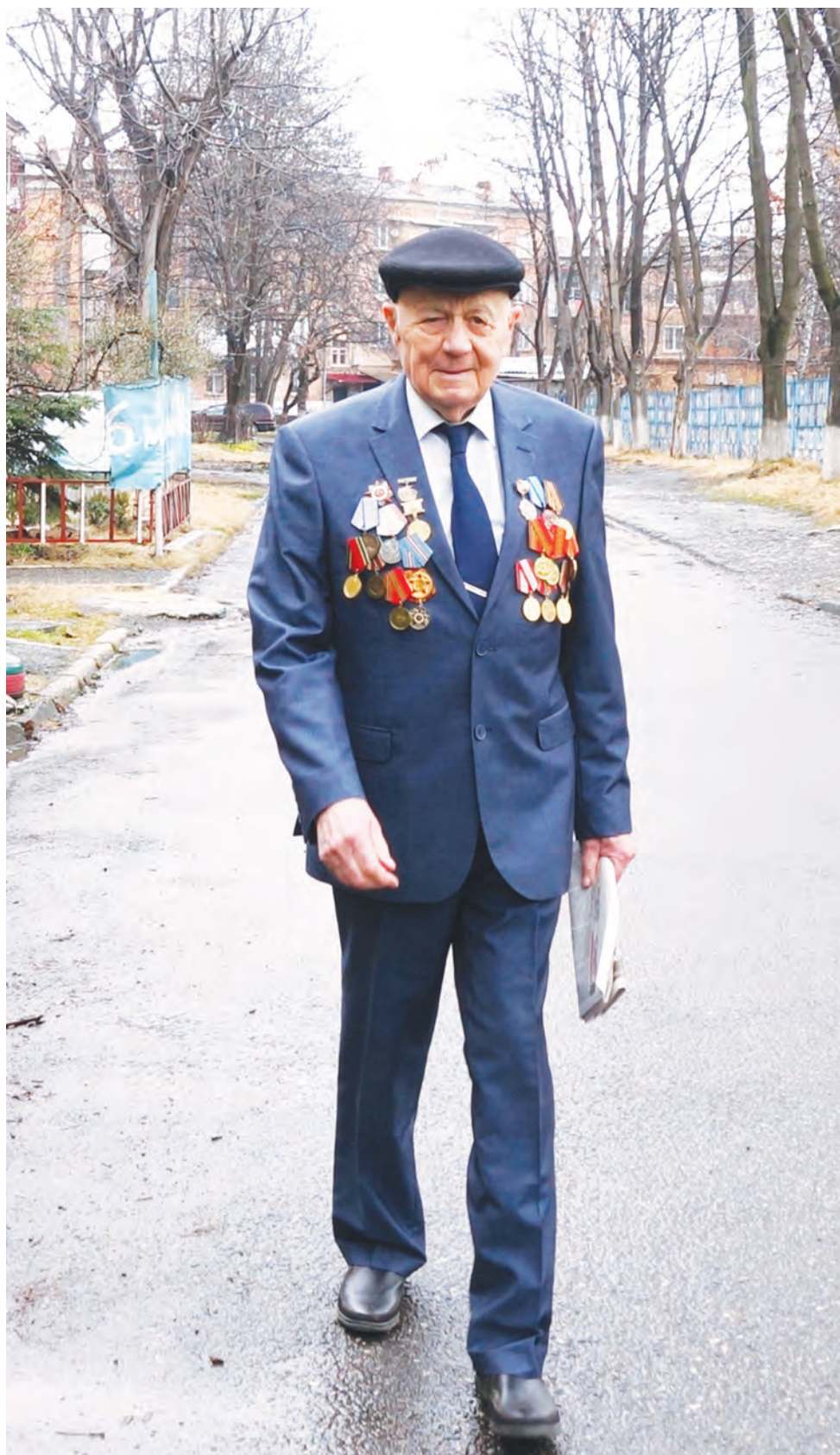
Николай Григорьевич силен не только физически, но и духом. А как иначе! Только активный образ жизни позволяет ему быть самостоятельным в почти 95, на которые он не выглядит. И это пример для многих.

Залина БЕДОЕВА, фото Татьяны ШЕХОДАНОВОЙ.