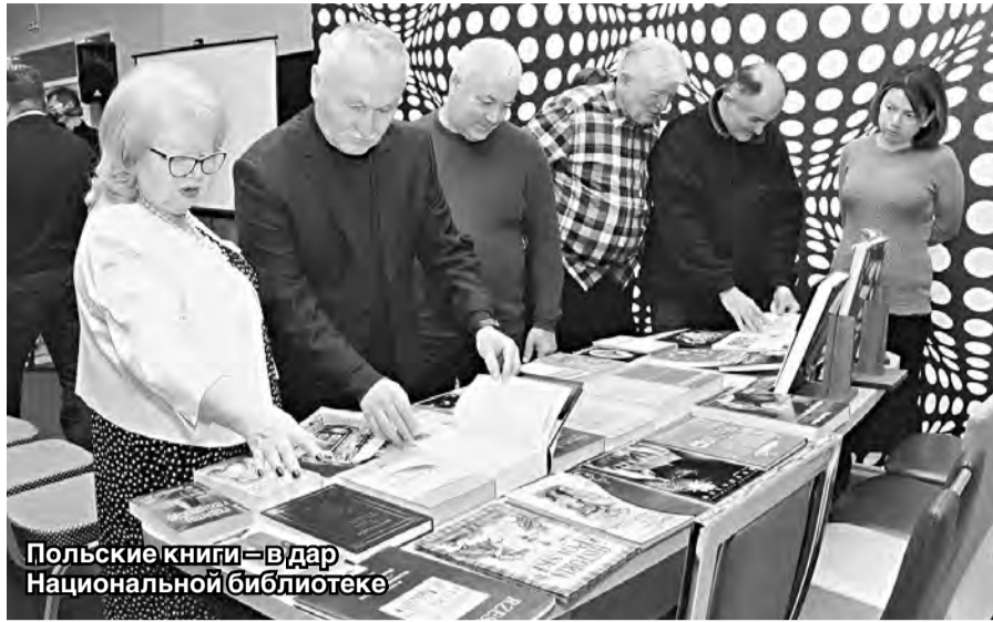
Польские книги — в дар Национальной библиотеке