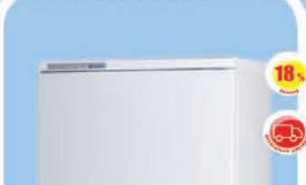
Холодильник Атлант 4010-022