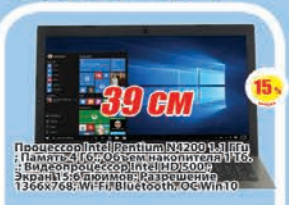
Ноутбук Lenovo 320-15IAP