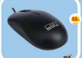
Мышь CBR CM-112 USB