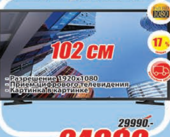
LED телевизор Samsung UE-40M5000AUX