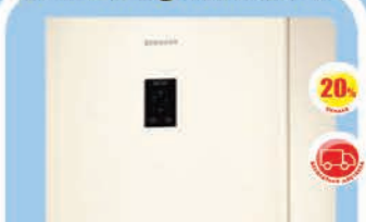
Холодильник Samsung RB 30J3200EF