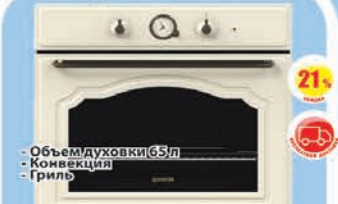
Духовка Gorenje El Classico BO 73 CU