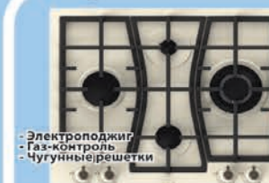
Рабочая поверхность Gorenje El Classico GW 65 CU