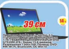
Ноутбук Dell Inspiron 3558