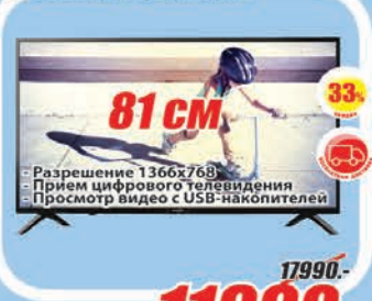
LED телевизор PHILIPS 32PHS4012