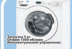
Стиральная машина Candy CS41051D1/2-07