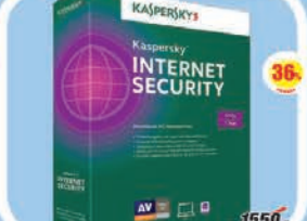
ПО Kaspersky Internet Security 2 уст 1 год