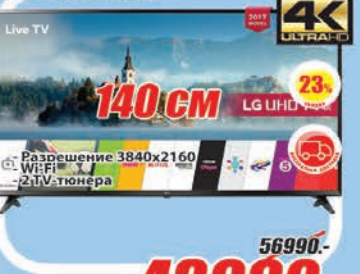
Смарт телевизор LG 55U630V