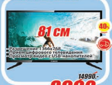
LED телевизор FUSION FLTV-32A100T