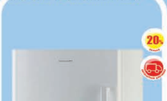
Холодильник Hisense RS-20DR4SAW