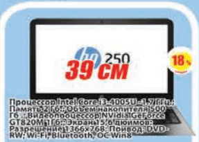
Ноутбук HP 250