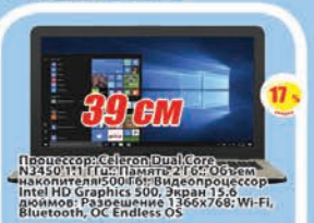
Ноутбук ASUS K540NA