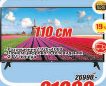
Смарт телевизор LG 43U500V