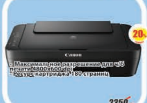
МФУ Canon Jet A4 Pixma MG2540S