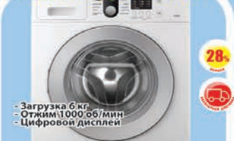
Стиральная машина Samsung WF8590 NLW9