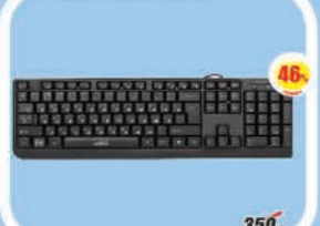
Клавиатура CBR KB-103 USB