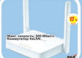
Маршрутизатор Mercusys MW305R