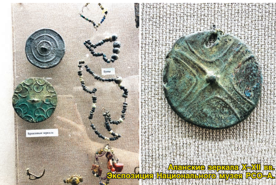
Аланские зеркала X–XII вв. Экспозиция Национального музея РСО–А.