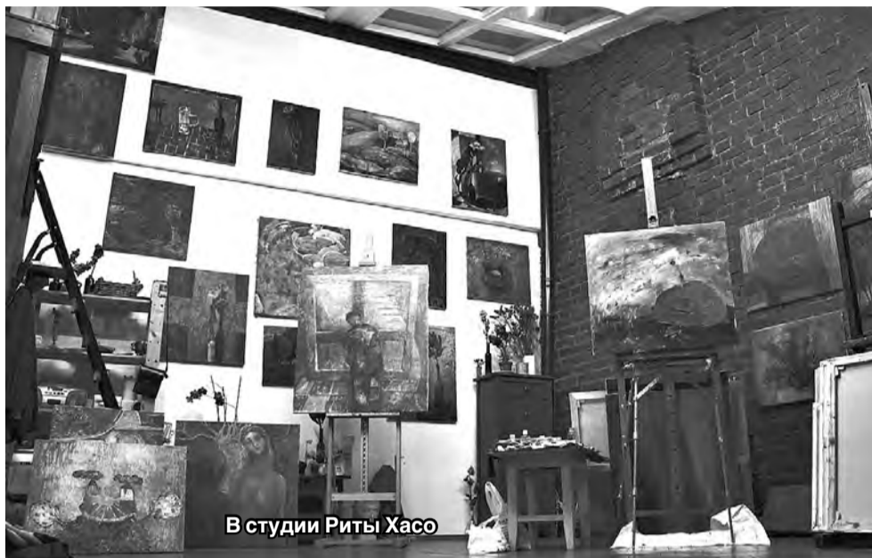
В студии Риты Хасо

Несмотря на то, что она в настоящее время живет и работает в Москве, Рита сохраняет тесную связь со своей малой родиной. Поклонники ее таланта уверены, что красота природы родной Северной Осетии, этого удивительно живописного края