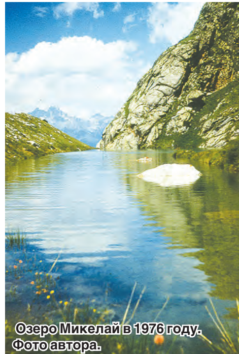
Озеро Микелай в 1976 году.

В Горной Дигории сейчас расположено 10 туристических баз. Каждый день, и особенно в выходные, сюда приезжают автобусы с экскурсантами почти со всего Северного Кавказа. В летний период вершины наших