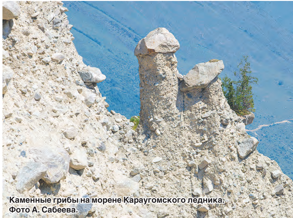
Каменные грибы на морене Караугомского ледника.

обрывами до 150–200 м. В них начали таять внутренние, так называемые мертвые льды. Из-за этого с морен начали происходить обвалы и оползни. Очередной такой обвал произошел в 1989 году в районе любимого места отдыха туристов и альпинистов урочища Райская поляна. Если раньше река Фастагдон протекала между левой береговой мореной и скальным склоном, то теперь, при обвале, ее воды хлынули в образовавшийся