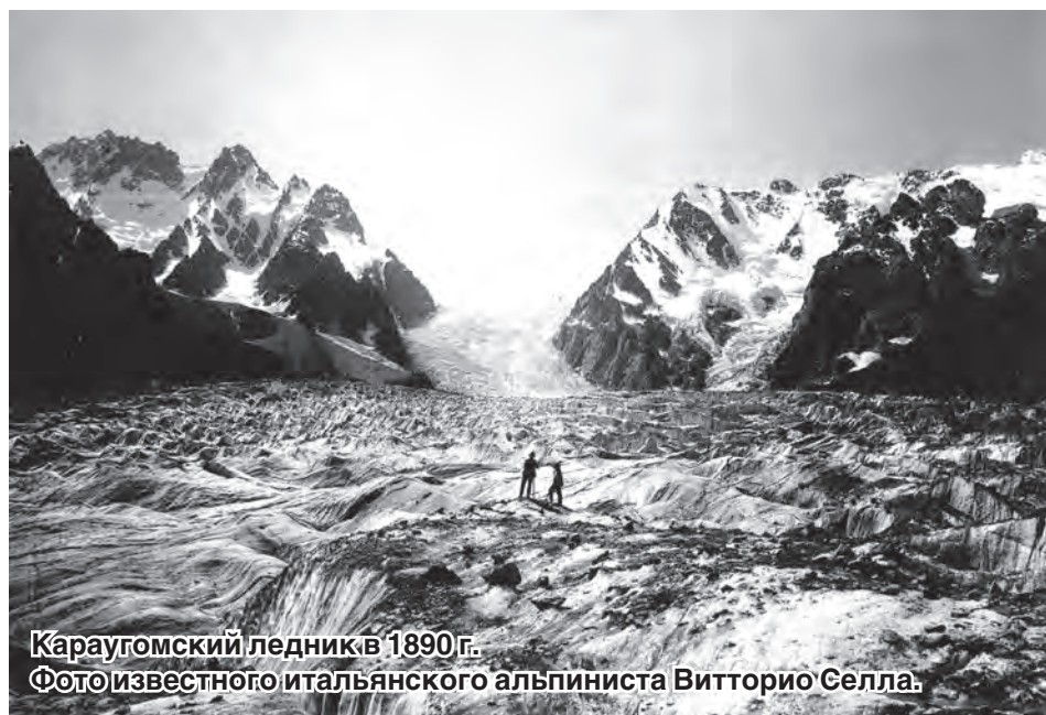
Караугомский ледник в 1890 г.

При дальнейшем отступании ледник не только сокращался в длину, но и значительно уменьшалась мощность его окончания. Если раньше тело ледника подпирало береговые морены, то теперь они сильно оголились и стали возвышаться над ледником