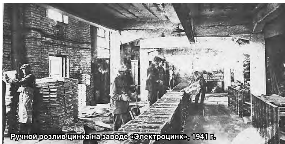
Ручной розлив цинка на заводе «Электроцинк», 1941 г.

Самому юному участнику акции было 11 лет, самому пожилому – 102 года.