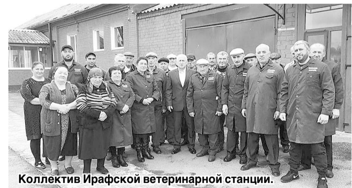
Коллектив Ирафской ветеринарной станции.

— У большинства людей районная ветеринарная служба ассоциируется в основном с лечением домашних питомцев. Но это лишь видимая часть каждодневной кропотливой работы, которую выполняют наши специалисты. Мы несем особую ответственность за сохранение