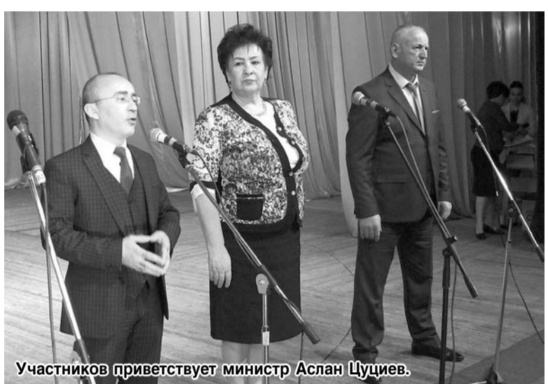
Участников приветствует министр Аслан Цуциев.