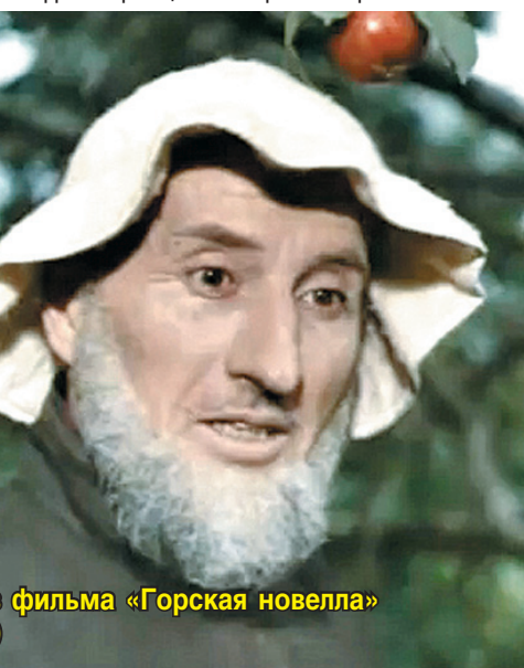
Кадр из фильма «Горская новелла» (1979 г.)