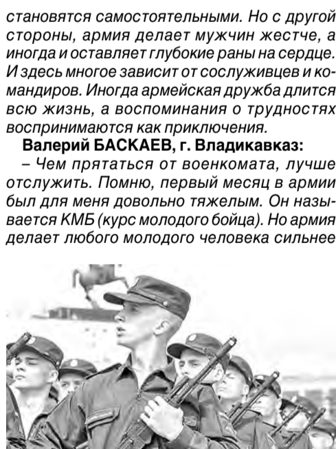
и физически, и духом. Невозможно забыть и ночные дежурства, и ранние подъемы, но все это закаляло меня. Не стоит бояться трудностей, любой мужчина должен уметь держать автомат, преодолевать свои страхи и чувствовать ответственность, не подводить своих командиров и товарищей.

- Армия - это школа жизни! Те, кто ее прошел, вспоминают армию одновременно и с содроганием, и с благодарностью. Это суровая школа, где проверяется и закаляется характер, где домашние мальчишки мужают,