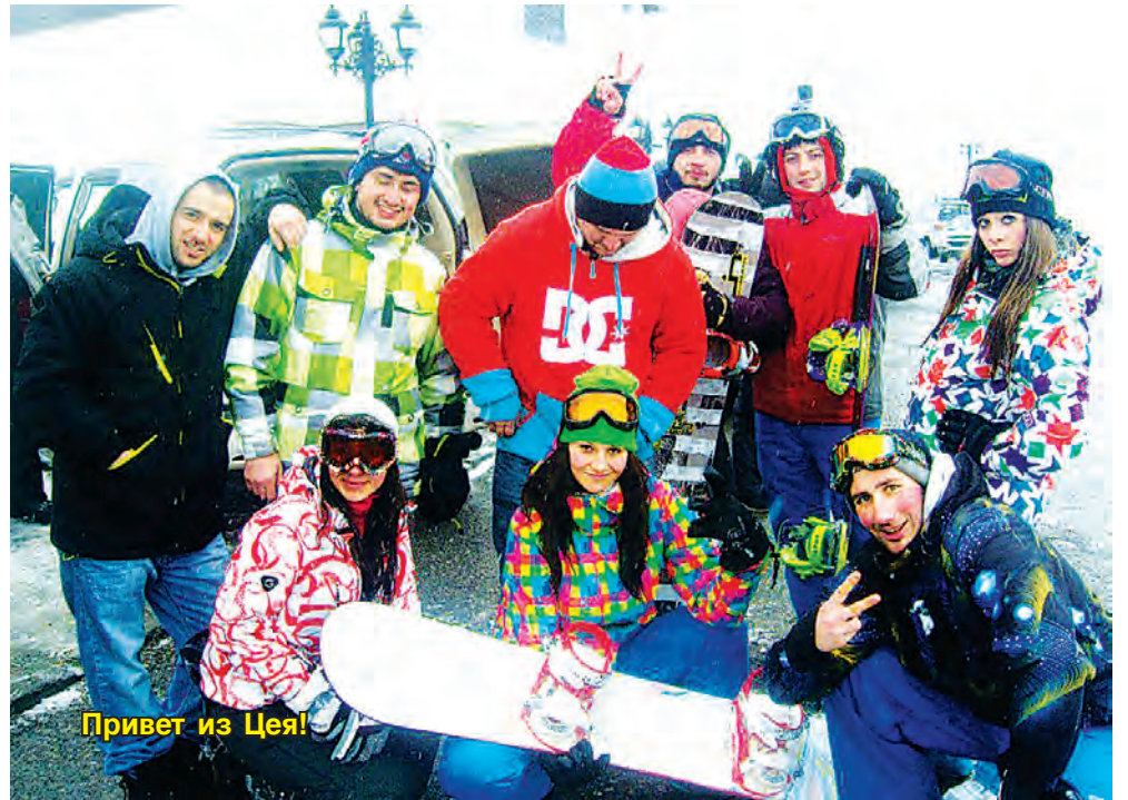
Привет из Цей!

Несмотря на некоторое недовольство отдыхающих, нельзя сказать, что в Цее смирились с недостатками. Замести-