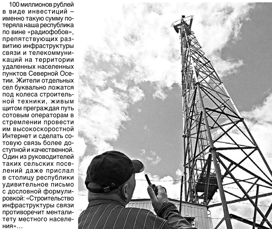
100 миллионов рублей в виде инвестиций – именно такую сумму потеряла наша республика по вине «радиобобов», препятствующих развитию инфраструктуры связи и телекоммуникаций на территории удаленных населенных пунктов Северной Осетии.