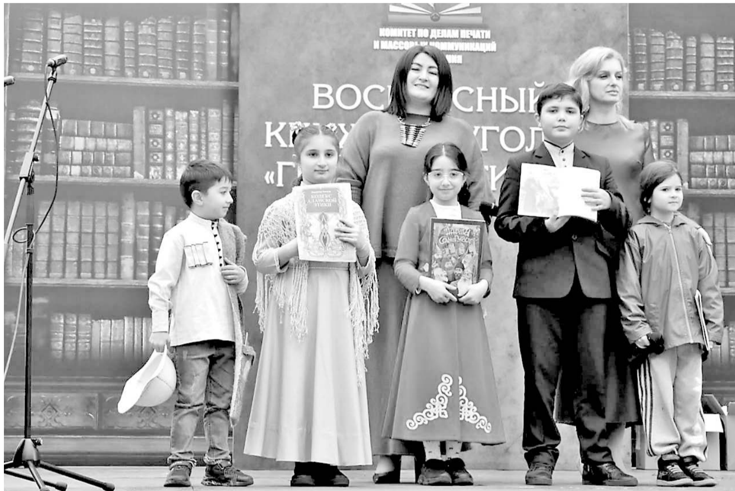
Книга с детских лет сопровождает нас по жизни и становится верным другом. Всегда можно найти в ней ответы на интересующие вопросы...