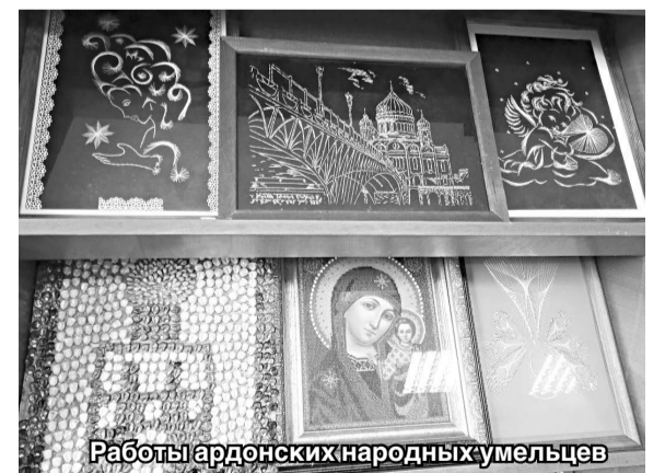
Работы ардонских народных умельцев