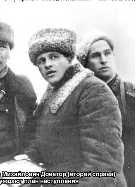
Командиры кавалерийских соединений Лев Михайлович Доватор (второй справа) и Исса Александрович Плиев (в центре) обсуждают план наступления

– Характерный бой был здесь у Плиева. Удары по флангам – наше любимое дело. В сложной обстановке решаем перерезать коммуникации немцев. Плиев держит двухдневный бой, имея малые силы, держит успешно и сам идет в атаку впереди своих конников. И выполняет задачу. А народ-то какой у него! Истребители: в одном только деле десять танков подбили! До чего дошли – палкой стучат по танку, кричат: «Выходи, окаянный!» Честное слово,