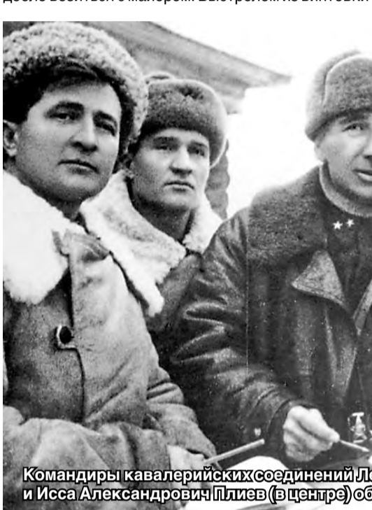
Командиры кавалерийских соединений Лев Михайлович Доватор (второй справа) и Исса Александрович Плиев (в центре) обсуждают план наступления