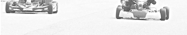
предоставленной с целью привлечения молодежи к занятиям автоспортом, популяризации военно-технических видов спорта среди молодежи и подготовке ее к службе в армии.

В состязаниях приняли участие шесть команд из Ростовской области, Дагестана, Карачаево-Черкесии, Северной Осетии, Ставропольского края и Кабардино-Балкарии — всего более 100 спортсменов от 6 до 50 лет.