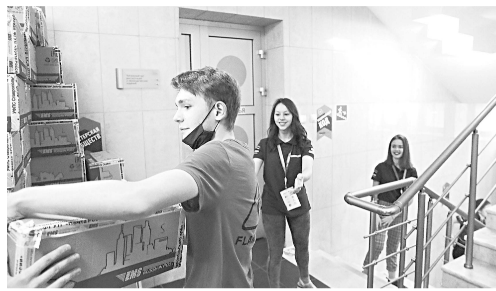
Почта России осуществит бесплатную экспресс-доставку посылок с раздаточными материалами участникам Северо-Кавказского молодежного образовательного форума «Машук-2020».

Почта России выступила официальным партнером Северо-Кавказского молодежного образовательного форума «Машук-2020». В связи с тем, что в условиях пандемии форум прошёл в онлайн-режиме, у его организаторов возникла необходимость отправки участникам 3 тысяч посылок с раздаточными материалами.