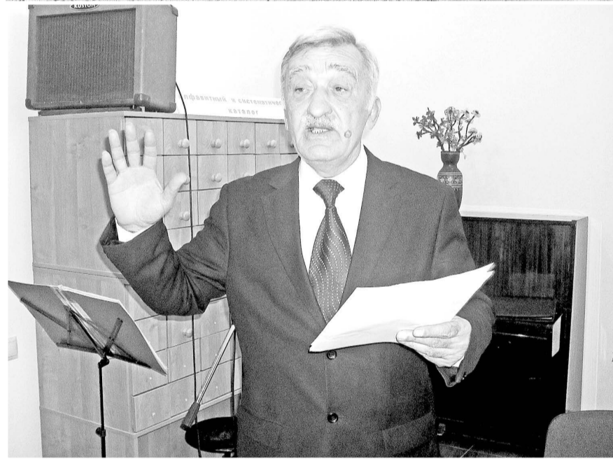
крыть специализированный курс до 15 человек при колледже культуры», – заключил Сикоев.