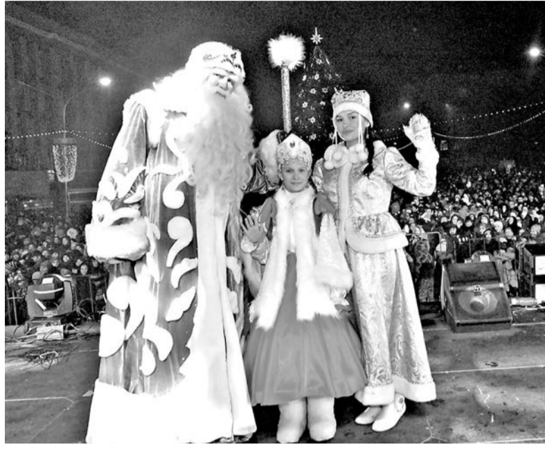
Соб. инф. Фото Татьяны ШЕХОДАНОВОЙ.

уже полюбопытствовали всем переднеазиатскими леопардами, нарисованными талантливой художницей Тамарой Джанайты-Тиболовой,